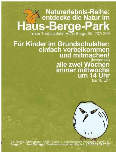
Grafik: Linneweber ARCHITEKTUR + QUARTIER